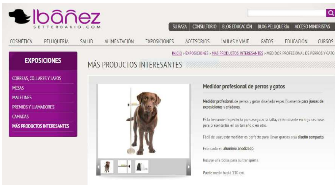
Figura: Medidor homologado.